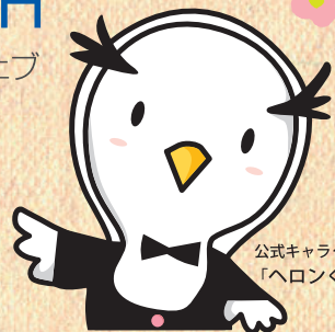
公式キャラクター 「ヘロくん」