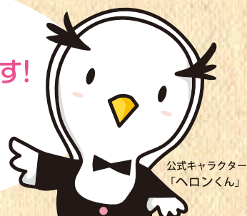
公式キャラクター 「ヘロンくん」

今までお使いの 医療費のお知らせが 「MY HEALTH WEB」になります！ ご利用には初回の 利用登録とパスワードの 設定が必要です